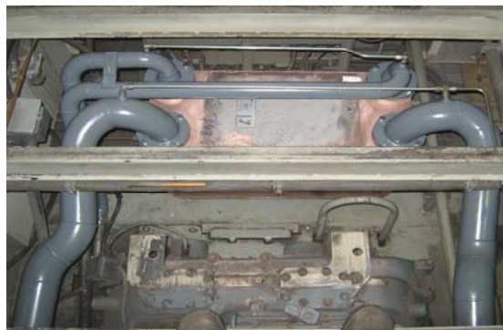
„Wärmetauscher im eingebauten Zustand“